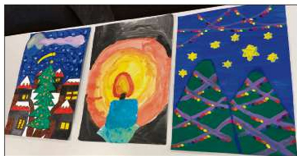
Diese drei Werke standen zur Auswahl, das linke hat letztendlich das Rennen um das Titelbild des nächsten Lions-Adventskalenders gemacht.

Den ersten Platz belegte dann schlussendlich mit großem Abstand ein Bild aus der Grundschule Kaltenweide, die das erste Mal den Sieger stellt.